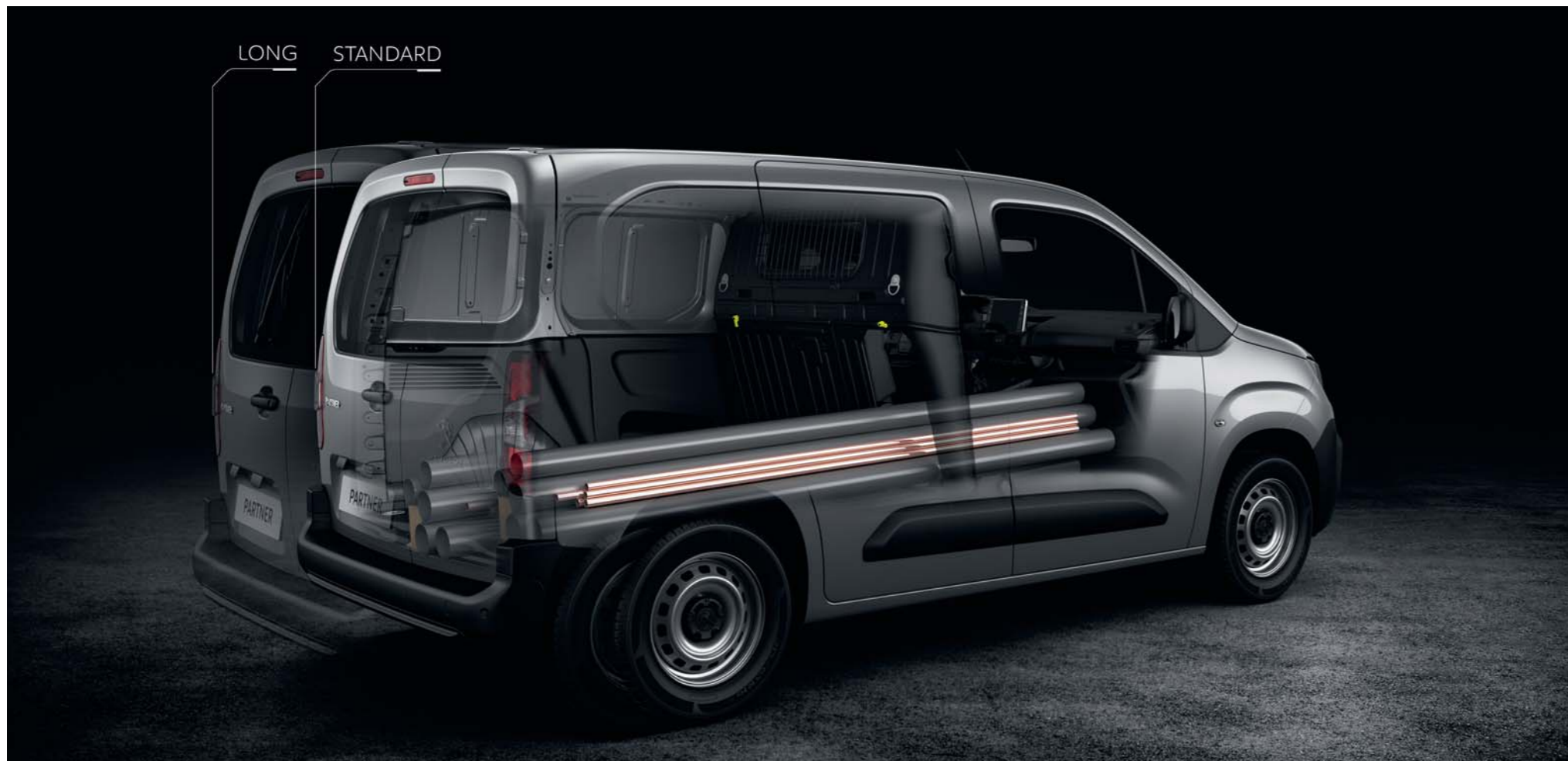
Illustration de principe : obligation d'utiliser le filet anti-rippage réglementaire afin de prévenir tout risque de déplacements d'objets chargés à travers la trappe de charge longue vers le conducteur.